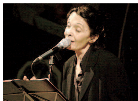
Lalli partecipa al concerto di domani

Il primo appuntamento è fissato per questa sera alle 19.30 in piazza Castello, dove si può assistere alla videoinstallazione “?-Absurdabsence”, performance artistica del fotografo Flavio Tiberti che offre