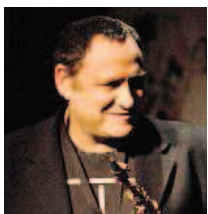
Il bravo sassofonista di origini israeliane Gilad Atzmon al FolkClub