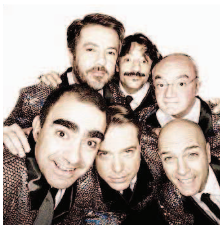
Elio e le Storie Tese il 6 luglio a Barolo

Collisioni però è anche altro. «Creatures selvage», il nome dell'edizione in programma dal 5 al 9 luglio, prevede già in calendario tantissimi cantanti e artisti di fama internazionale. Elton John, che si esibirà l'ultimo giorno della kermesse, tiene a Barolo l'unica tappa italiana del 2013. Grande attesa anche per l'inglese Ja-